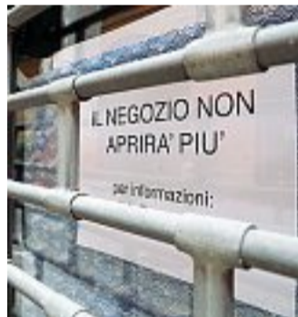
Via Fusari Chi non ce la farà a ripartire

A un primo sguardo sembrerebbe la stessa Bologna di prima. Magari di fine luglio. Però senza turisti. E con cittadini mascherati e dalla pelle color latte. Aguzzando la vista si nota tutta, la quarantena che Bologna si è lasciata alle spalle. La settimana enigmistica della grande riapertura post lockdown sembra partire con l'entusiasmo giusto. Bologna torna a godersi la colazione al bar, a farsi la messa in piega, a concedersi un po' di shopping e a concludere la giornata con una